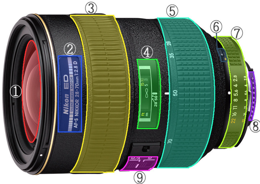
Nikon AF-s 28-70mm/F2.8D 렌즈